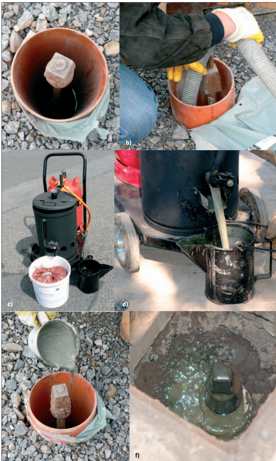
Bild 2: Verfüllung der Hülshre mit DENSOKS-MASSE und dem DENSOMELTOMAT: a) Hülshre vor der Verfüllung, b) Reinigung des Hülshres, c) DENSOKS-MASSE und DENSOMELTOMAT Aufschmelzgerät, d) Entnahme der aufgeschmolzenen DENSOKS-MASSE, e) Verfüllung des Hülshres, f) Schiebergestänge und Hülshre nach der Verfüllung Fig. 2: Filling of the sheathing tubes with DENSOKS compound and the DENSOMELTOMAT; a) Sheathing tube prior to filling, b) Cleaning of the sheathing tube, c) DENSOKS compound and DENSOMELTOMAT melting unit, d) Decanting of the molten DENSOKS compound, e) Filling of the sheathing tube, f) Actuating mechanism and sheathing tube after filling

Bend direkt aus dem Kocher vergossen werden. Üblicherweise erfolgt der Verguss jedoch praxisgerecht aus einem separaten Vergussgefäß.